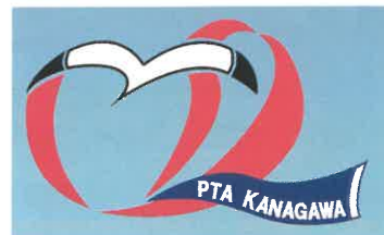
関東大会シンボルマーク

第68回関東地区高等学校PTA連合会大会は神奈川県で行われ、メインテーマである「つなぐ——学び、行動するPTA」のもと大会が実施されました。今年はコロナ対策としてハイブリット開催となり、現地での視聴、ネット配信での視聴のどちらかを選ぶことができました。6月下旬から山梨県においてもコロナの感染者数が増加してしまい、ネット配信での参加となってしまいました。2学年の副会長2名が参加し、他校の活動報告を聞き、蕪崎工業高校でも取り組むことのできる内容がいくつかあることに手ごたえを感じました。