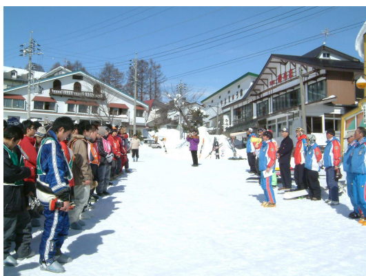
(スキー学校・開校式)

柵池高原は白馬にあり、ゴンドラ、クワッドリフト等設備は整っていて、スキー教室を実施するには十分な環境です。