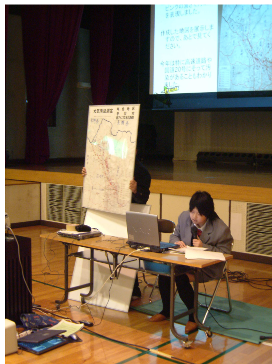
環境化学科の「大気汚染測定」の発表

ロボコン山梨等各種コンテストに参加したロボットの展示。みんな興味深く観察していました。