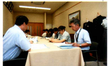
《蕪工活性化合同会議》