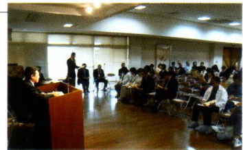
《PTA定期総会》 多数の会員の参加のもと盛況に…。