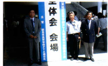
《全国高P連大会》 会場前にて…。記念撮影？