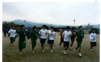
《甘利山登山強歩大会》