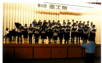
《蕪工祭》 PTA合唱団の心を込めた合唱風景