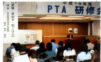
《PTA研修会》 多数参加、皆さん真剣に聞き入って…。