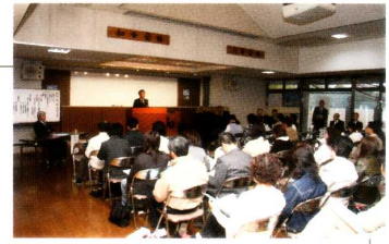
《PTA定期総会》 多数の会員の参加のもと盛況に…。