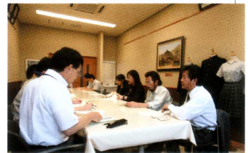
《蕪工活性化合同会議》