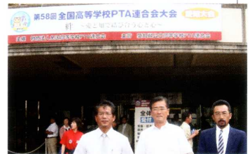
《全国高P連大会》 会場前にて…。