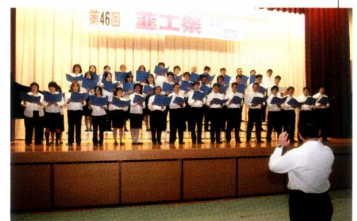
《蕪工祭》 PTA合唱団の心を込めた合唱風景