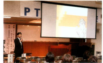
《PTA研修会》 多数参加、皆さん真剣に聞き入って…。