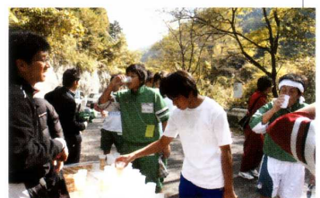
《甘利山登山強歩大会》